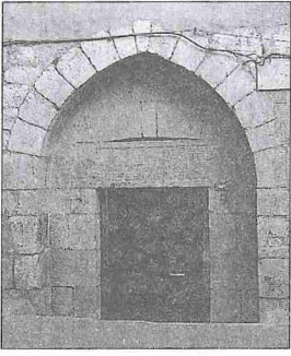
el-Eşrefiyyetü'l-Berrâniyye Dârülhadîsî'nin cümle kapısı - Dimaşk / Suriye

ederken bütün selâtin camilerinde Bu-hârî, Müslim ve Meşârik'taki (Meşâriku'l-enuvâr) hadislerin okutulduğunu söyler ve medrese dışında kaydıyla üç dârülhadîsin adını verir (Seyahatnâme, I, 318).